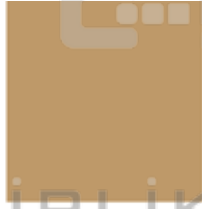
PANTONE 465 C