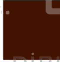
PANTONE 4625 C