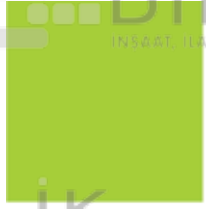
PANTONE 382 C

Kurumsal renklerin farklı kullanım alanlarına göre sahip oldukları değerler ve kodlar aşağıdaki şekildedir.