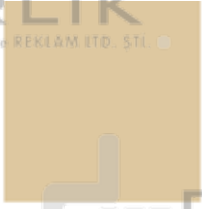
PANTONE 467 C