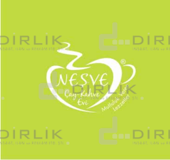
PANTONE 382 C

Logonun zeminli alanlarda kullanımında aşağıda görülen renk tercihleri kullanılmalıdır.