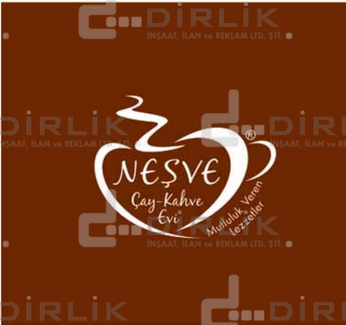
PANTONE 168 C